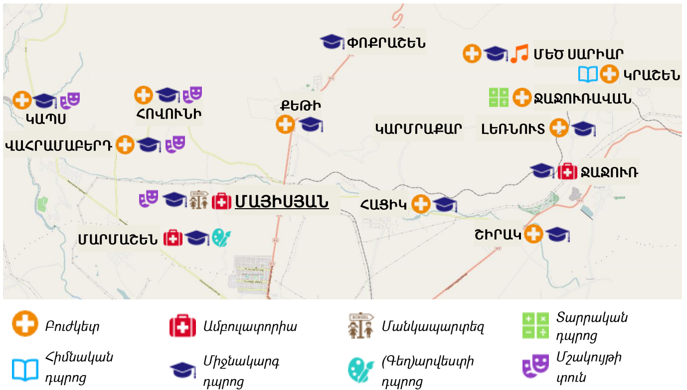
Քարտեզ 2. Մարմաշեն համայնքի կրթական, առողջապահական ու մշակութային հաստատությունների տեղաբաշխումը